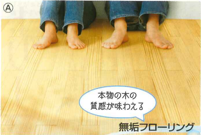
本物の木の 質感が味わえる

発行 (株)リフォーム産業新聞社 本社 〒104-0061 東京都中央区銀座8-11-1 TEL.03-6252-3450 FAX.03-6252-3461 暮らしをよくする、 専門メディア