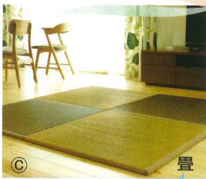
好きな場所に和の空間が作れる置き畳

施工方法にはフローリングを剥がして貼り替える方法と、剥がさずに重ね貼りする方法があります。剥がして貼り替える方法は、リフォームの前後で床の高さ