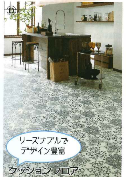
リーズナブルで デザイン豊富