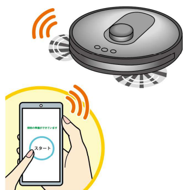
スマホと連動できるタイプなら、お出かけ中でもスマホからスタート！

て以上の家でも各階に持ち運ばば掃除してくれるので、掃除の時間を軽減することができます。 ・掃除範囲によって機種を選べる…コンパクトな部屋を掃除するなら、一般的なタイプで十分。複数の部屋を掃除する場合は、部屋の間取りを認識できる内蔵のセンサーがついたタイプがおすすです。 ・拭き掃除ができるタイプも…ゴミを吸い込んだ後に拭き上げるため、雑巾がけの手間が省けます。