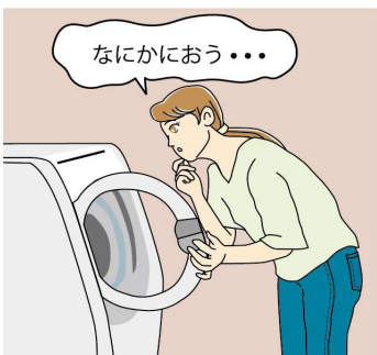
焦げ臭いにおいは、洗濯機内部の部品が摩耗している可能性があり、危険です。ただちに使用をやめてメーカーに相談することをおすすめします。

操作パネルが反応しないときは、電源プラグを抜き、10分ほど置いて再度接続しても改善しなければ、寿命の可能性が。6年以上使用している