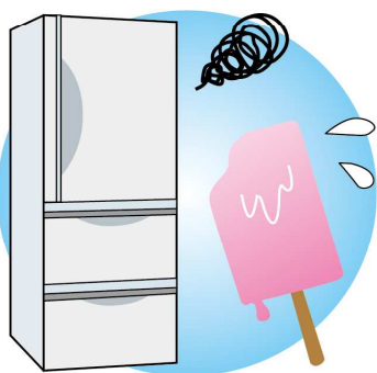
アイスなどが溶けてしまうなど症状があれば、内部の機械や部品の不具合の可能性。メーカーや電器屋さんにご相談を。

冷えない、冷えが悪い場合は、食品を詰め込みすぎて冷気の出口を塞いでいないかチェックを。またドアパッキンの劣化の場合もあります。冷気の出口を確認し、冷気が正常に出ている